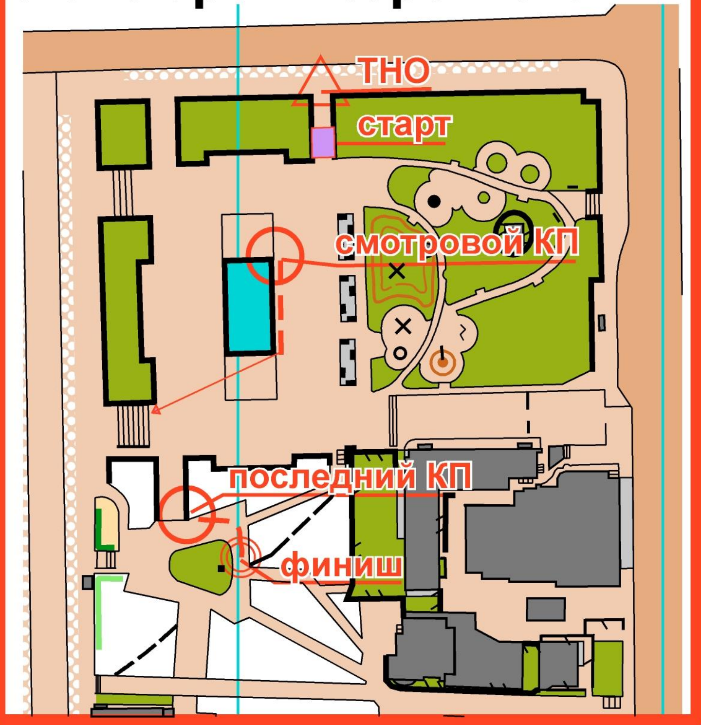
схема арены соревнований

Получение чипов до 9:15, начало старта в 9:30