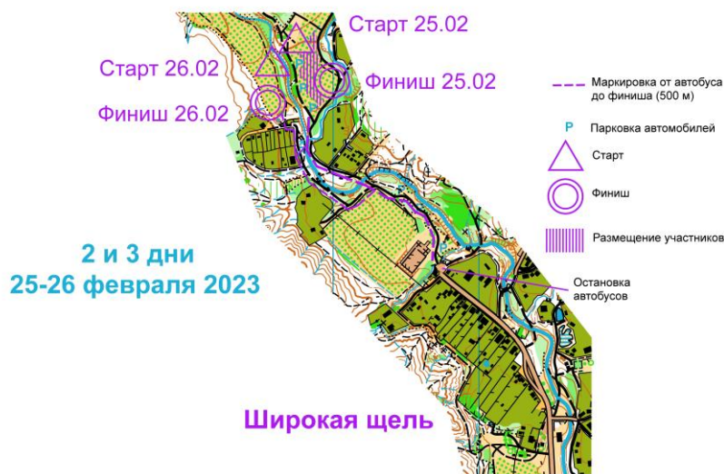
Схема старта и финиша Соревнований по спортивному ориентированию "Памяти Ц.Л.Куникова"

Добраться до Широкой щели также можно на проходящих пригородных автобусах на Возрождение, Пшада, Архипо-Осиповка до остановки «10 км», далее пешком 3 км.